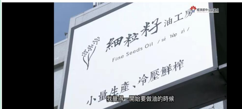
105年度中南地區中小企業融資診斷服務計畫亮點個案—細粒籽油工坊