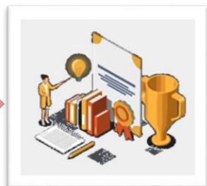
優化產業人才環境