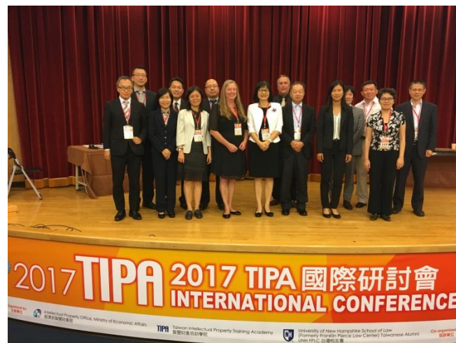
2017TIPA國際研討會 國際專利法制與實務發展趨勢