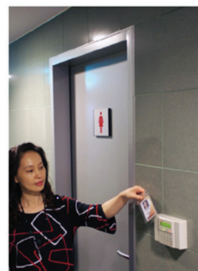
女性洗手間增設刷卡門禁