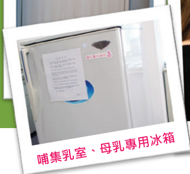
哺集乳室、母乳專用冰箱