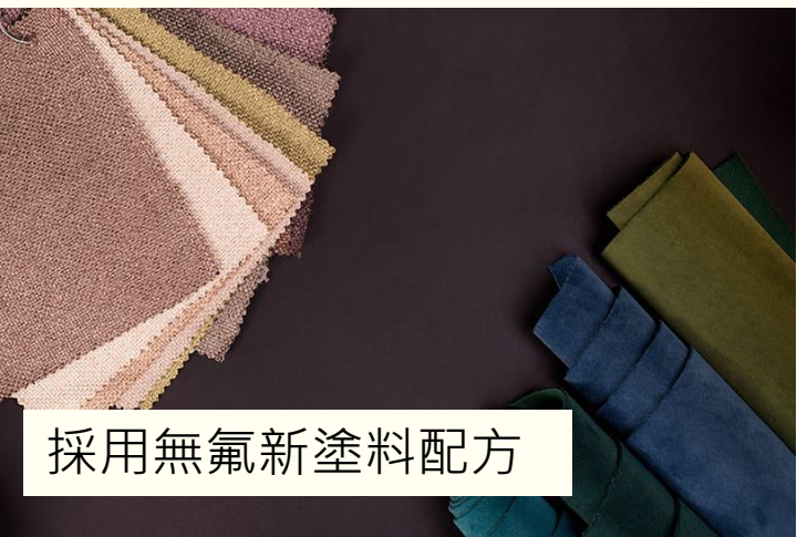
採用無氟新塗料配方