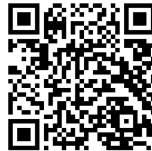
因應COVID-19 疫情之視訊診療

https://www.nhi.gov.tw/Content_List.aspx?n=682E61D7A9C3A59D&topn=787128DAD5F71B1A