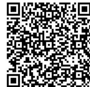
COVID-19全國 指定社區採檢院 所地圖